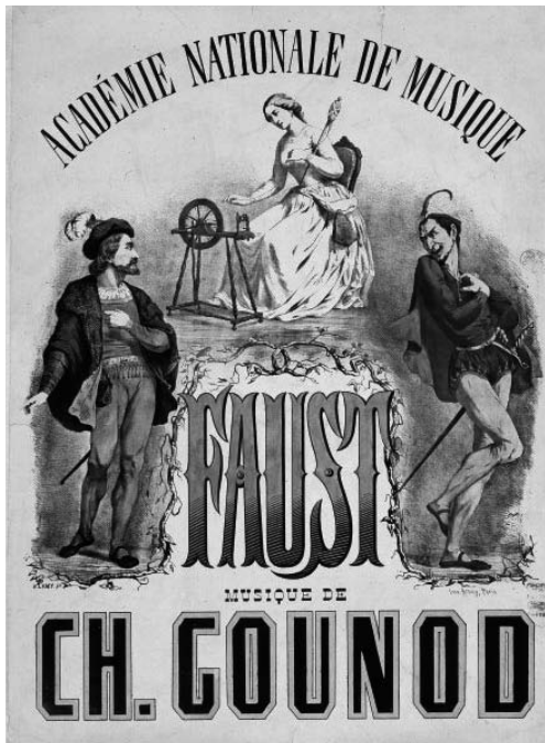
Affiche de Faust pour l'Académie nationale de musique, A. Lamy / BnF

Cette élégante valse se caractérise par une basse et deux accords légers présents durant toute la pièce. Après une introduction dynamique, les violons entrent dans la danse. Les hautbois poursuivent plus aériens. La suite est une succession de phrases plus mélodieuses les unes que les autres. L'atmosphère devient tourbillonnante, retour du thème principal, accords, percussions... tous les ingrédients concluent avec éclat.