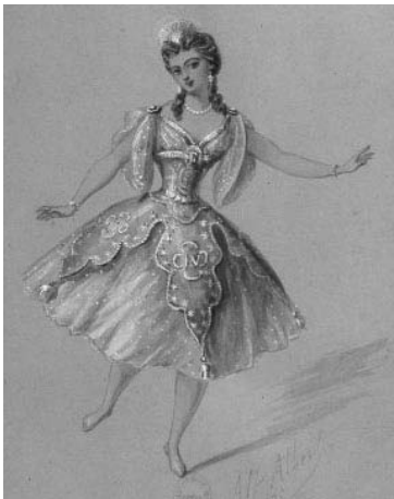
Maquette de costume pour Coppélia par A. Albert