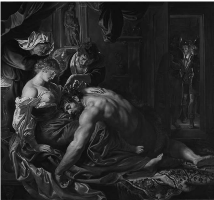
Samson et Dalila par PP. Rubens

Camille Saint-Saëns s'est basé sur un épisode de la Bible : Samson voulant libérer son peuple des Philistins, est séduit par Dalila. Tombé dans son piège, il réussit quand même sa mission, au prix de sa vie.