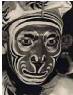
Maquillage du Roi singe

Les rôles des comédiens sont divisés en quatre groupes : sheng , dan , jing et chou .