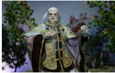
Figure de marionnette de la troupe Liao Wen Ho

Le théâtre de marionnettes , qui donne vie à des personnages légendaires de la culture chinoise, est un art populaire dans l'île. On peut aussi assister à du théâtre d'ombres, introduit à Taïwan il y a environ deux cents ans et qui utilise des figurines découpées dans du cuir de buffle. Les histoires, accompagnées de musique et de chant, comportent souvent des scènes de combat très appréciées du public.