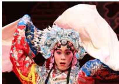
Les manches flottantes

Traditionnellement, il n'y a pas de décor sur scène. La peinture du visage, qui a remplacé les masques, met en évidence le caractère des personnages. Les costumes sont brodés et colorés, on y ajoute de longues manches blanches flottantes que l'acteur agite, par exemple pour indiquer aux musiciens qu'il va commencer à chanter. Le jeu des yeux, du visage, les mouvements des bras et des mains, la démarche, la manière d'entrer sur scène, la manière de rire, tous ces gestes sont codifiés de manière très précise.