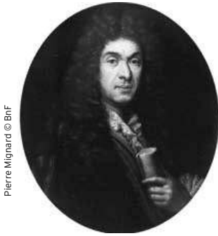
Pierre Mignard