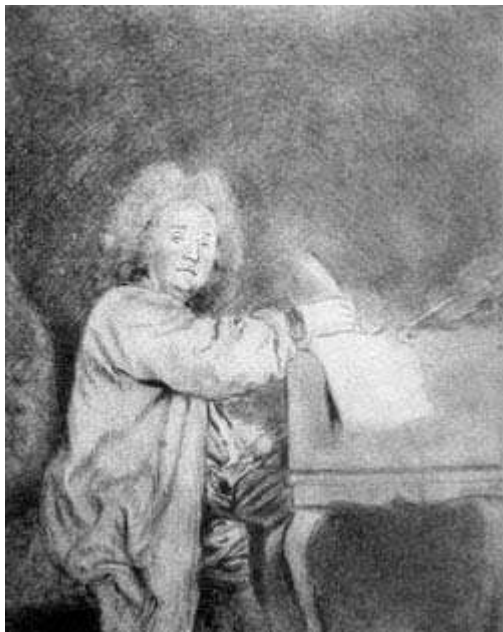
Jean-Féry Rebel, Watteau

Les reines (Marie Leckzinska puis Marie-Antoinette) et les favorites (Mme de Pompadour et la comtesse Du Barry) qui succèdent à Marie-Thérèse ne lui ressemblent pas : très averties en matière d'art, elles contribuent à redonner son lustre à Versailles... et à faire oublier