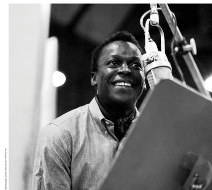
Miles Davis lors d'une séance d'enregistrement de l'album Kind of Blue (1959)

Entre 1955 et 1961, le trompettiste Miles Davis et le saxophoniste John Coltrane gravent ensemble quelques-unes des plus belles plages de l'histoire du jazz. Passant progressivement d'un quintette emblématique du hard bop triomphant, alliant élégance et sens du swing, à un sextette plus névrosé marqué par le romantisme du pianiste Bill Evans, les deux hommes couronneront leur collaboration en publiant en 1959 l'album Kind of Blue , disque légendaire qui marquera en profondeur les orientations du jazz moderne.