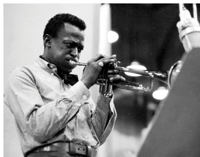
Miles Davis lors d'une séance d'enregistrement de l'album Kind of Blue (1959)