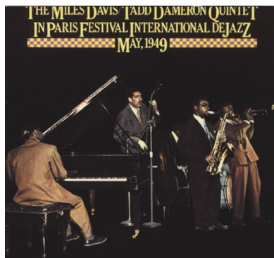
Pochette de l'album In Paris Festival International De Jazz, enregistré en 1949 et publié en 1977

Miles décide de s'installer à New York. Pour obtenir l'assentiment de ses parents, il fait mine de s'inscrire à la prestigieuse Julliard School of Music , mais n'a en fait qu'une idée en tête : écumer chaque nuit les clubs de jazz de Harlem pour retrouver celui que tout le monde appelle Bird , Charlie Parker, le chef de file génial du bebop , nouveau style de jazz en plein essor. Très vite Miles devient un habitué de la fameuse 52 e rue où tous les jeunes musiciens révolutionnaires new-yorkais ont pris l'habitude de se retrouver. Il n'a que 19 ans lorsqu'il intègre le quintette de Parker et enregistre ses premiers solos de trompette, laissant naître, dans un style mélodique tout en retenue, une sensibilité lyrique particulièrement émouvante.